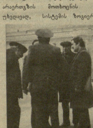
პარტორგანიზაციის მდივნები, მათი მოადგილეები და პირველადი პარტიული ორგანიზაციის მდივნები.