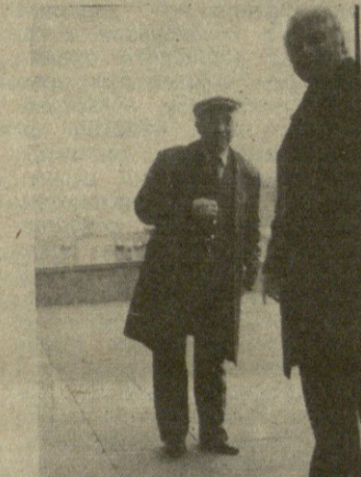
რაიონულ განყოფილებათა უფროსები, მათი მოადგილეები და პირველადი პარტორგანიზაციის მდივნები.