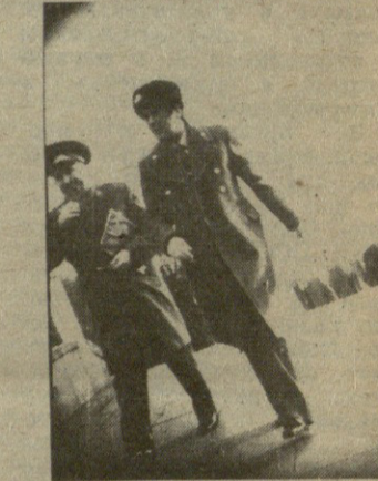
თანამშრომელი ფორმის ტანსაცმლის ტარების წესების დარღვევით, ზოგიც სამოქალაქო ტანსაცმლით გამოცხადდა.