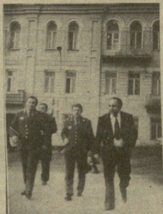
ახლახან, საქართველოს კომპარტიის ცენტრალურ კომიტეტში გამართულ რესპუბლიკის პარტიული აქტივის კრებაზე სხვადასხვა პასუხისმგებელ მუშაკებთან ერთად მოწვეული იყვნენ საქალაქო და