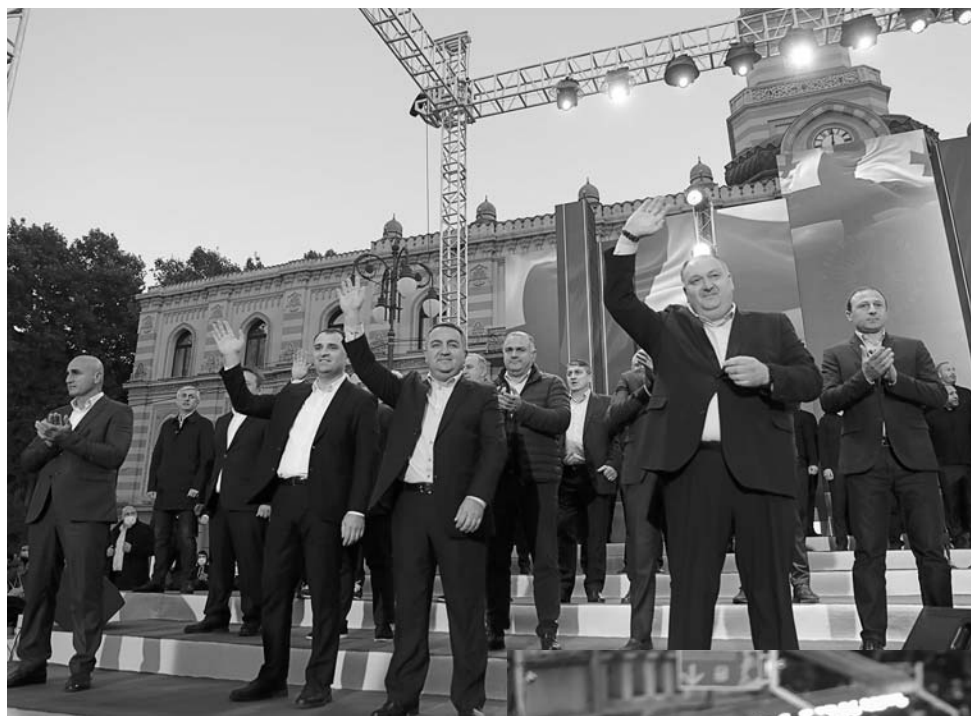
შინაურ ოკუპანტებს და დამპყრობლებს.

მადლოზა გირჩიანი ქართული ხალხს, რომელმაც უმძიმესი ფსიქოლოგიური ტერორის, შანტაჟის, პროცოკაციების მიუხედავად უკვე მერვე ომი მოუგო