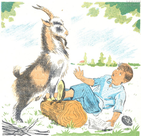
ნახატი ს. გაბაშვილისა