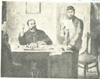
ი. ბ. სტალინი ი. ქავჭავაძესთან გაზეთ „ივერიის“ რედაქციაში 1895 წელს. ფოტოგრაფიურული ქვია სახალხო მხატვრის უნა ჯაფარიძის ნაბათიან.