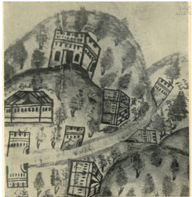
რაჭა 1737 წლის ერთ-ერთ რუკაზე

ტალა, სხვაგა, სხიერი, ურაგი, უეში, უწერა, ფარახეთი, კვაშხიეთი, ღები, ღვა- რდია, ლუდა, შაორი, შეუბანი, შქმერი, ცახი, ძეგლევი, ძირაგული, წედისი, წუ- ქეთი, წორბისი, ჭალა, ჭალისუბანი, ხირ- ხონისი და ხონჭიორი. უმრავლესობა ამ ჩამონათვლიდან დღესაც არსებობს.