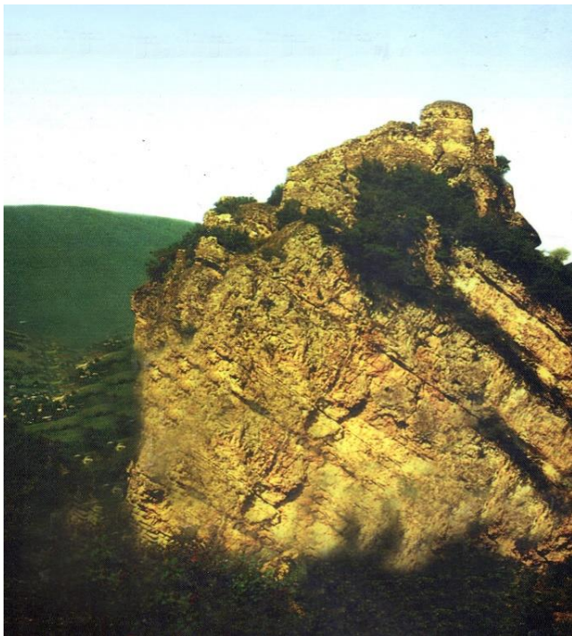
კლდეზე აგებული კვარაცხე

რაჭის ცნობილი მკვლევარის გ. ბოჭორიძის მონაცემებით რაჭაში არსებობდა ბარეულის, ბეჟანის, გუნდუშის, ზნაკვის, სორის, ნინიას, ჭიდროთას, ხიდიკარის, ხიმშის და სხვა ციხე-სიმაგრეები. ბევრი მათგანი ვახუშტი ბატონიშვილსაც აქვს აღწერილი, ხოლო ზოგიერთი მას რუკაზეც დაუტანია. რაჭის ცნობილი ციხე-სიმაგრეებს შორის გამორჩეული ადგილი კვარა ციხეს უჭირავს.