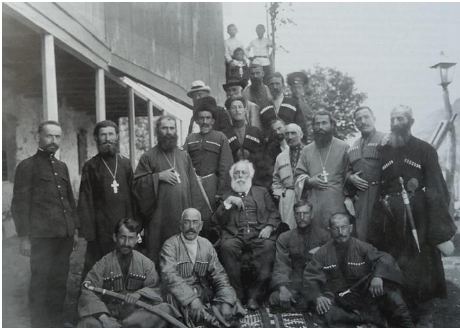
აკაკი წერეთელი ქ. ონის წარმომადგენლებთან

ამ მოვლენის შესახებ ქუთაისელმა კინოოპერატორმა ვასილ ამაშუკელმა გადაიღო მსოფლიოში ერთ-ერთი პირველი დოკუმენტური ფილმი „ქართველი მგოსნის აკაკი წერეთლის მოგზაურობა რაჭა-ლეჩხუმში 1912 წლის 21 ივლისიდან 2 აგვისტომდე“. ამ მოგზაურობის ერთ-ერთი ინიციატორი იყო რაჭველი ხაბაზი იობა ისაკაძე. დეტალურად დაიგეგმა მოგზაურობის თორმეტივე დღე. წინასწარ განისაზღვრა თუ სად გაჩერდებოდა პოეტი, ვინ გაუწევდა მასპინძლობას, რომელ ოჯახებში გაათევდნენ ღამეს და რომელ სოფელში უნდა გამართულიყო შეხვედრა. აკაკი წერეთელს ძალიან უყვარდა იობა ისაკაძე და ლექსიც მიუძღვნა ამ კეთილშობილ ადამიანს. განსაკუთრებით დასამახსოვრებელი შეხვედრა მოუწვევს დიდ პოეტს ქალაქ ონში.