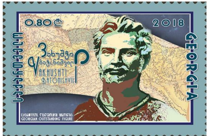
ვახუშტი ბატონიშვილისადმი მიძღვნილი ქართული საფოსტო მარკა (2018 წ.)

ლის მეურნეობას, ტოპონომიკას, ეთნოგრაფიას და ანთროპოლოგიასაც.