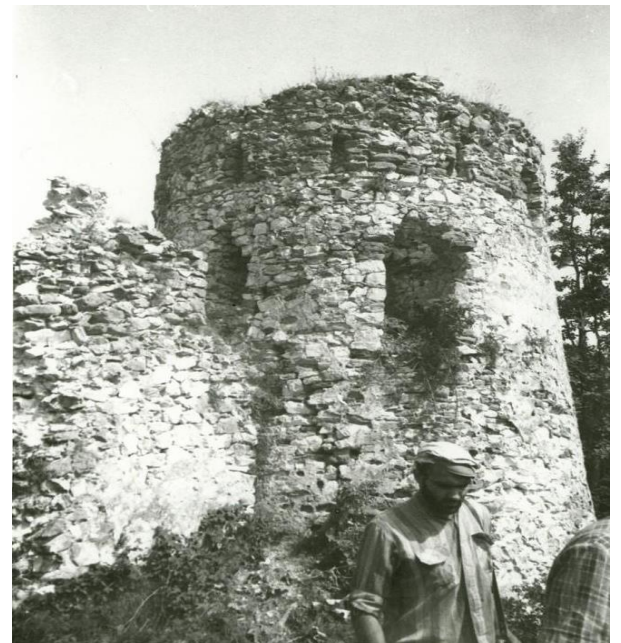
კვარაცხის კოშკი რაჭის მიწისძვრამდე