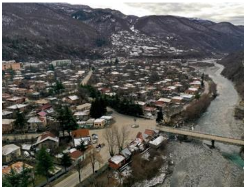
ქალაქ ონის საერთო ხედი

„... შემდეგ დილით ჩვენ მივედით სოფელ ონში, რომელიც სარგებლობს არცთუ მცირე მნიშვნელობით კავკასიის ამ მხარეში. ეს დიდი ბრწყინვალე ნაგები სოფელი განლაგებულია რიონის მარცხენა ნაპირას... თუმცა სახლები აქ უმეტესად ერთსართულიანია, მაგრამ სოფლის შუაგულში აღმართულია ქვითკირის დიდი შენობა... ყველგან შესანიშნავი წესრიგი და სისუფთავე სუფევდა; ბაღები და ყანები შემოვლებული იყო მტკიცე ღობეებით, ვენახების სიმრავლე გვიჩვენებდა ხალხის ყაირათიანობასა და შეძლებულობას... გლეხების ცხოვრება აქ მატერიალური შეფარდებით, ეტყობა არ განსხვავდება შვეიცარიის და ტიროლის უფრო ღარიბი ნაწილების ცხოვრებისგან. ერთსართულიანი კავკასიური ქოხები დიდი აივნებით ძლიერ წააგავს შვეიცარიულ ქოხებს... სახლებთან მისასვლელი გადიოდა ფართო, კარგად დაცული ჭიშკრებით, როგორც ჩვეულებრივად გვხვდება ქალაქარე აგარაკებში ინგლისში...“