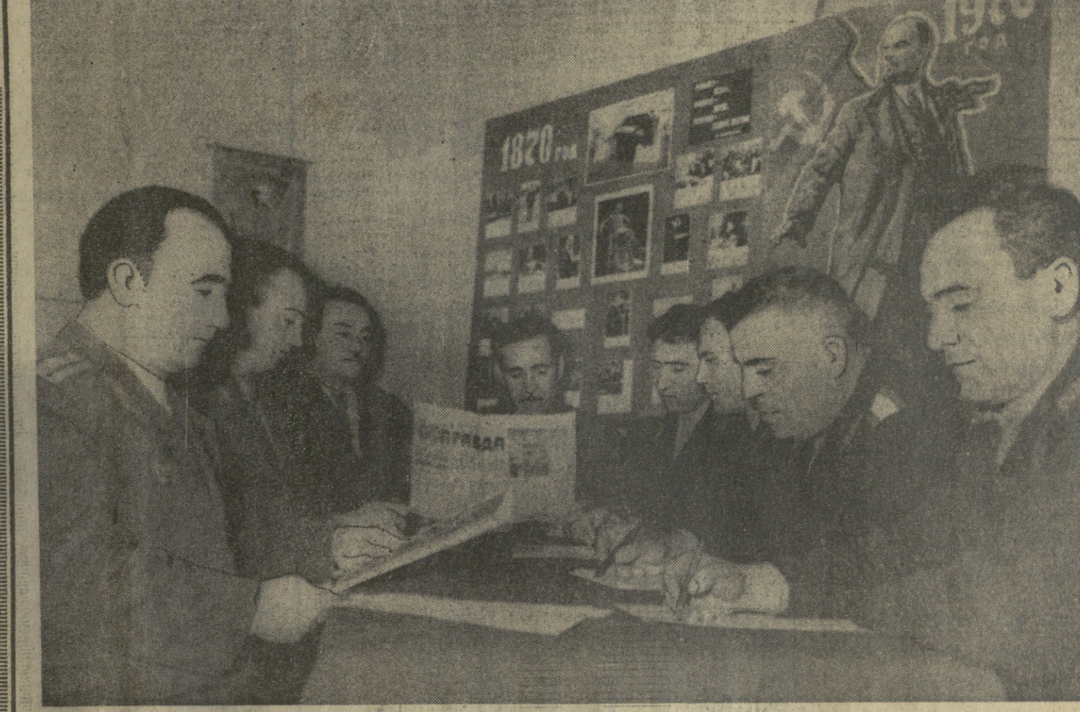
ახალქალაქის შინაგან საქმეთა რაიკომის წევრები საქართველოს კომპარტიის ცენტრალური კომიტეტის პირველი მდივნის ახ. მ. პ. მუხომბაძის წინადადებას განვიხილეთ...