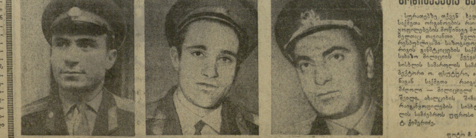
სურათზე ოქტომბრის 1969 წლის ორგანიზაციის წევრები...