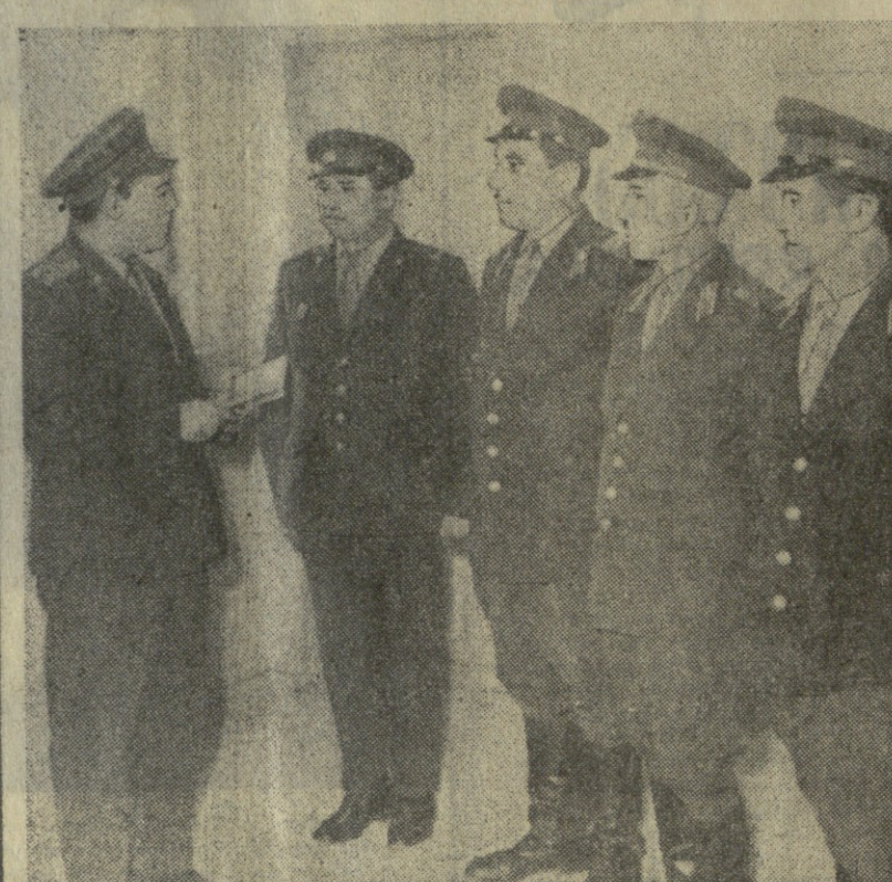
სამრავალი გასული წლების მუშაობის...