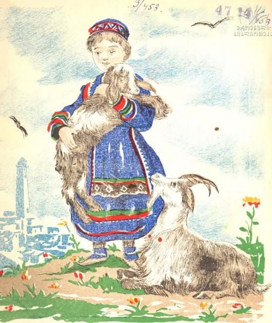
ჭარჯიანის პირველ გვერდზე ნახატი—„კატარა მწევში“ შესრულებულია, მხატვარ ზ. გაბაშვილის მიერ.

გამომცემლობა № 55 სტამბის შტკ. 753 ტირაჟი 7000 ფე 02537 ფანი 5 მან.