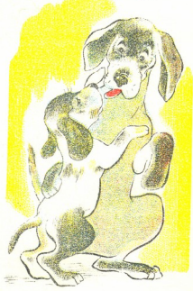
თარგმანი ა. გვირიძის ნახატები ს. გაბაშვილისა

რომელი დამშვიდდა და თავისი პატარა კული ააქიცნა. დედა ამოვიდა კიბეებზე; გახარებული რომელი მიეგება მას და ლაქუცი დაუწყო.