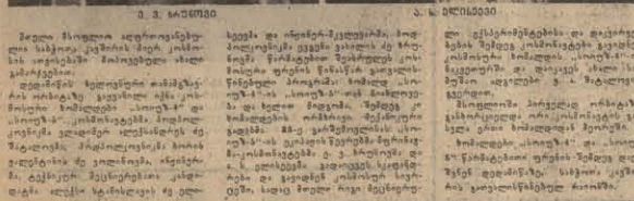
გ. გ. შალაბა