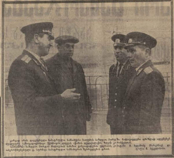
სპეცსუბის სსს ზეზინი სპეცსუბის სამსახურში...