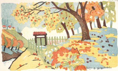
ხიხატი. გ. ჯაფარიძისა