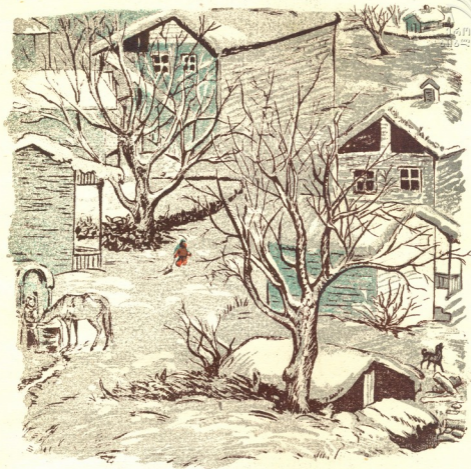
ნახატი გივი გულისაშვილისა