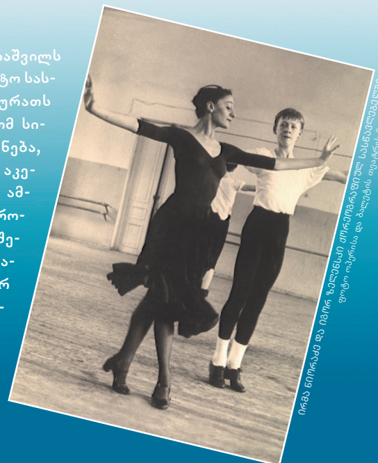
ირმა ნიორამ და ივორ ზელენსკი თეატრში ერთად ცეკვობენ.