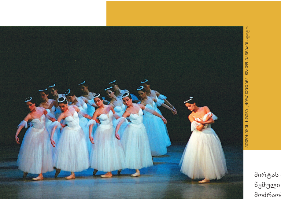
ვილისების სცენა „ჟიზელიდან“

მაგრამ, ყველაფერი მაინც მაყურებლის მონონებაზეა დამოკიდებული. საქეტაკლს ახლდა ოვაციები, და რა თქმა უნდა... აზრთა სხვადასხვაობა. ეს ბუნებრივიცაა. „ჟიზელი“ მარად ცოცხალი კლასიკაა. ბალეტომანებმა იმდენად ზუსტად იციან საქეტაკლის ლიბრეტო, რომ უმნიშვნელოდ შეცვლილ ნიუანსსაც კი გრძნობენ. ახალი საქეტაკლი კლასიკური ვერსიისაგან ძალიან განსხვავებული არ გახლავთ. პირველ მოქმედებაში ჩასმული პა-დე-დე შეიცვალა პა-დე-სიზით; ვილისების სცენა და მთელი მეორე მოქმედება თითქმის უცვლელია და მარიუს პეტიპას უკვდავ ვერსიას მიყვება.