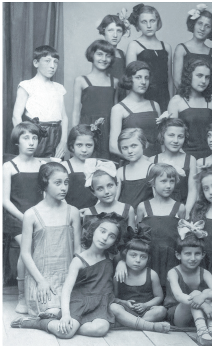
მარია პერინი და მისი აღსაზრდელები

ქართული საბალეტო სკოლის საფუძვლის ჩაყრა კი გამოჩენილი იტალიელი მოცეკვავისა და პედაგოგის მარია პერინის (1873-1939) სახელს უკავშირდება. იგი 18 წლის ასაკში ჩამოვიდა თბილისში და ჩაატარა საღამო, რომელიც სხვადასხვა საბალეტო ნომრებისაგან შედგებოდა. 1897-1907 წლებში მარია პე-