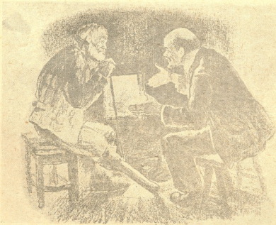
და ისინი დიდხანს საუბრობდნენ ცეცხლის პირას.