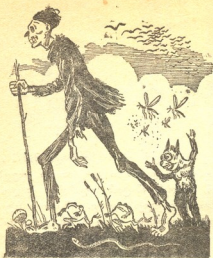
აი, როგორი იყო სიღარიბე

სიღარიბემ თვალი გაახილა, გაიზმორა. ცხრა და კიდევ ცხრა ხელი ამოივლო წირპლიან თვალებში და მიიხედ-მოიხედა. ამაღა არსად იყო. სიღარიბემ იფიქრა, ალბათ კიდევ მძინავსა და ხანჯალივით გრძელი კბილები მკლავს დააქირა. ეტყინა.