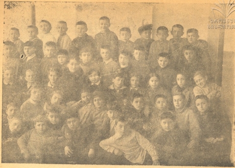
მე-14 საშუალო სკოლის III-კ. მოწაფეები.