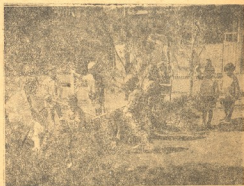
120 საბავშვო კერის ბავშვები ბოსტანში მუშაობენ.

გავიხადეს ტანისამოსი, თქაფუნით გა- ირბინეს წყალი და გაღმა გავიდნენ. ისინი რიგრიგობით აღიოდნენ ტირიფებზე და იქიდან ხტებოდნენ წყალში, ხანაც ერთ- მანეთს ახტებოდნენ ზურგზე. ცურვა და ტირიფებიდან ხტომა რომ მობეზრდათ, მერე თავიანთი ჯოხები აიღეს და ისევ მდინარეს ჩაუდგნენ. დაინახავდნენ თუ არა თევზს, მას ნელნელა გაიტყუებდნენ სი- ლაზე და გრძელი ჯოხი მოულოდნელად