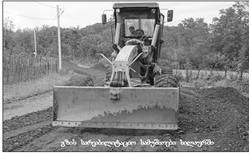
ვზის სარეაბილიტაციო სამუშაოები სილაურში

წორხაზოვნების სამუშაოები ჯერ არ გვინახავს. ადგილობრივი სპეციალისტებიც სკეპტიკურად არიან განწყობილი მიმდინარე სამუშაოების მიმართ და იგი საფრთხის შემცველად მიაჩნიათ ხიდისთვის.