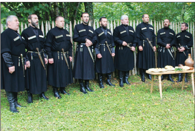
16 სექტემბერს, ოზურგეთისა და ჰელმის (პოლონეთი) შემოქმედებითი კოლექტივების მონაწილეობით, გაიმართა „ტურიზმის ფესტივალი“ - საუკეთესო პრაქტიკა ტურისტული პროდუქტების პოპულარიზაციის