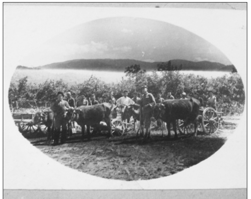
შემოქმედის ახალგაზრდობის ფიზკულტურის მოედნის მშენებლობაზე, მაისი, 1941 წ.

იმავე წელს ჩატარდა საქართველოს პირველობა „ტყავის ბურთის“ პრიზზე, სადაც „ჩაქუხამ“ კვლავ პირველი ადგილი აიღო. შემდეგ კი ყოფილი საბჭოთა კავშირის 15 რესპუბლიკის გუნდებს შორის მე-3 საპრიზო