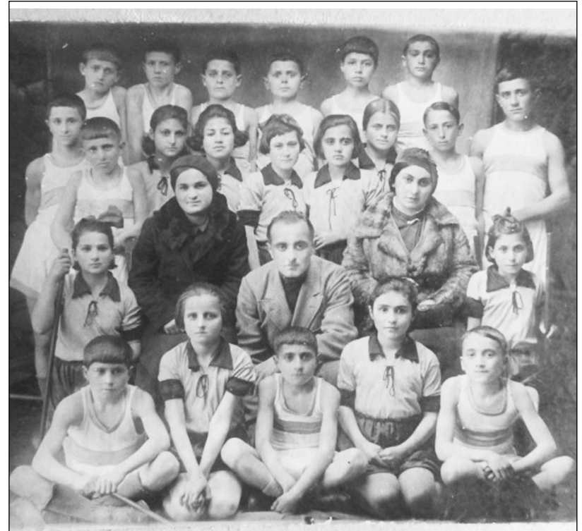
ამდ. ტამნიკუშთან არსებული 7-წლევანის ფიზკულტურის წრე, 1934 წ.