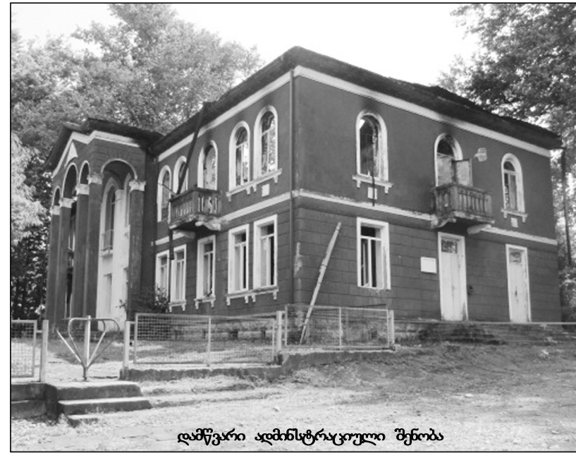
დამწვარი ადმინისტრაციული შენობა

„ჭრიჭინა“ ხომ გინახავთ, ქართული მხატვრული ფილმი, რომელიც დიდმა სიკო დოლიძემ სწორედ ამ სოფელში გადაიღო? გაიხსენეთ, რას ამბობს ჭრიჭინაზე ყურებამდე შეყვარებული ამ ფილმის პერსონაჟი შოთა, პროფესიით არქიტექტორი: მივალ ნაგომარში, მიმაქვს პროექტი. ჰოდა, საინტერესოა, ახლა ვინ ჩაიტანს ამ შენობის აღსადგენად შესაბამის პროექტს ნაგომარში.