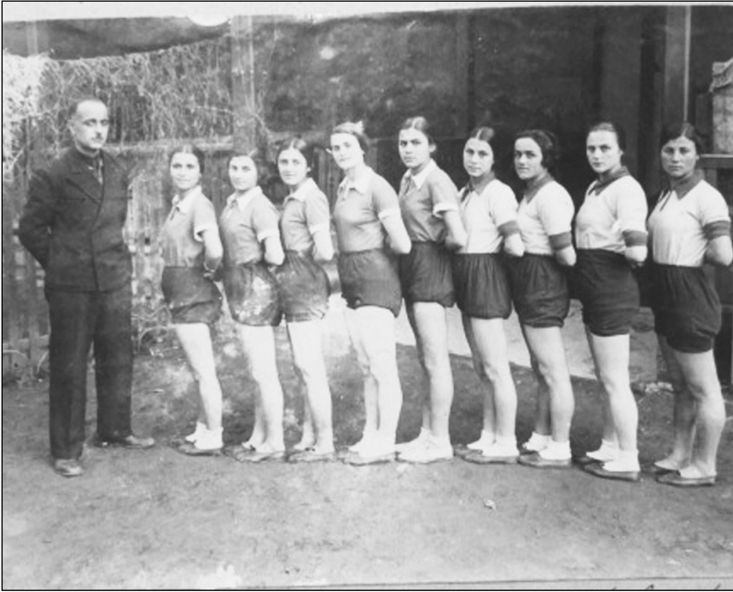
საქართველოს ქალთა ტანვარჯიშის უმეცნეოს მონაწილეები ოზურგეთში. 8 მარტი 1938 წ.