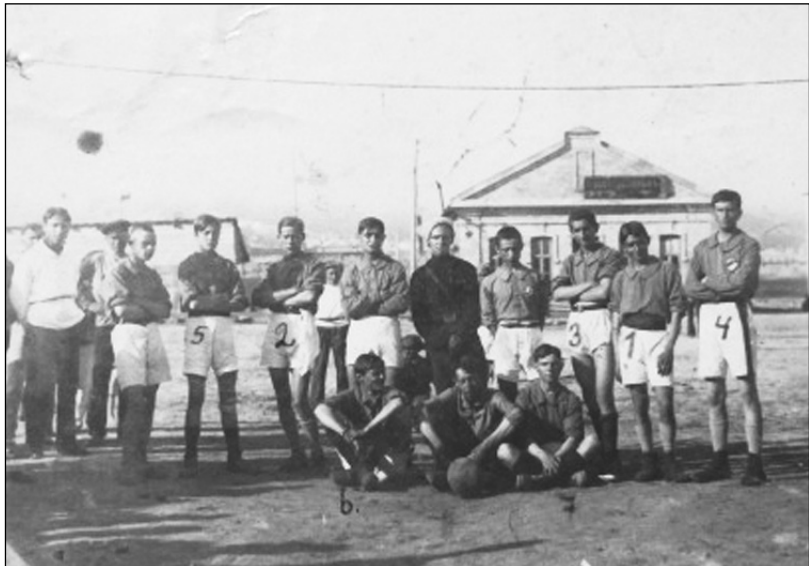
მ. ნოვოროსიისკის „პოდვინსკის“ სახელობის ფეხბურთელთა გუნდი. 15.06.1920წ.