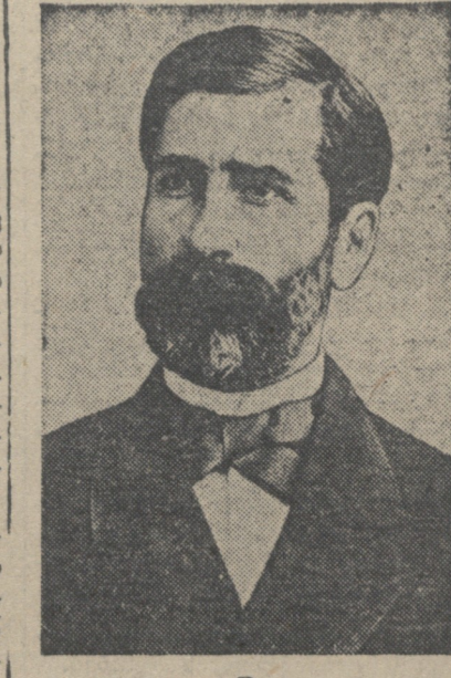
საქართველოს მთავრობის ბრძანებით

ბრძანებით წესდებოდა ცხადობა... (ბრძანების ტექსტი)