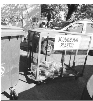
ალიონი. პლასმასის ნარჩენები არც ბარს აკლია და არც მთას. დახლოებით 10 წლის წინ ქ. ოზურგეთში გამავალ მდინარე სკუჩაზე (იქ, სადაც მდინარე ბუქს უერთდება) რკინის დამჭერი ბაღეების მოაწყვეს დასუფთავების სამსახური ხშირად წმენდა ამ ადგილს და მდინარე ბუქსში, შემდეგ კი ნატანებში პლასმასის ნარჩენებს საგრძობლად იკლავ, მაგრამ მერიის ნაგავსაყრელზე მოიყარა თავი ამ ბოთლებმა. ოზურგეთის „სერვისცენტრმა“ მდინარე ნატანების შესართავთან მოაწყო პლასმასის ბოთლების და სხვა ნარჩენების დამჭერები, მათი თანამშრომლები შემდეგ

ნავით შედიოდნენ მდინარეში და მორგებული ნარჩენები კვლავ მერიის ნაგავსაყრელზე გადასქინდათ. როცა რევიონის მთავარი მდინარეები (სუფსა, ნატანები, ჩოლოქი) დიდდება, დამჭერები ვერ შევლის მოზღვავებულ სხვადასხვა სახის ნარჩენს და ზღვის სანაპირო სხვადასხვა ნარჩენების ტყვეობაშია. წელს შპს „საქართველოს მყარი ნარჩენების მართვის კომპანის“ გურიის შვილი სანაპირო ზოლის ინფრასტრუქტურის გაუმჯობესების და მართვის სამსახური შეიქმნა, რომელსაც მუნიციპალური ქონებიდანაც გადაეცა სათანადო ტექნიკა. ერთი თვეა ოზურგეთის ქუჩებში სიხლუა. ოზურგეთის „სერვისცენტრმა“ პლასმასის ბოთლების შესაგროვებლად სპეციალური კონტეინერები დადგა. –წელს აპრილის საუბრით ოზურგეთის მუნიციპალიტეტის პლასმასის ბოთლების კონტეინერების მომსახურების მხნით სპეციალური ტექნიკა გადასცა. პლასმასის ბოთლების შესაგროვებლად წინასწარ შესწავლილ 8 ლოკაციაზე განთავსეთ პლასმასის კონტეინერები. კერძოვრებით პლასმასის სფეროში გადაამუშავებელი კომპანიები თავს