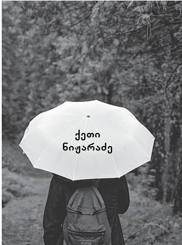
OMNES VIAE ROMAM DUCUNT ყველა გზა რომში მიდის

მზე შუბის ტარს რომ გადასცდება, ფრთხილად ვაპარებ მზერას ოფისის დაგმანული ფანჯრის მინისკენ. ამ მინის იქით ბაქანია — იმ ხალხით სავსე, ვინც იცვლის ადგილს, ხასიათს და ზოგჯერ — მიმიკებს. ბაქანი, სადაც ნამზომები ციფერბლატებზე იცვლებიან და აღრიცხავენ წამსვლელს და მომსვლელს, ბაქანი, სადაც ისვენებენ ხოლმე მგზავრები, მტერის ახალ ფენას იმატებენ ნამგზავრ სამოსზე. ჩუმიად ვდგები და გამოვდივარ აუჩქარებლად, ვჯდები გრძელ სკამზე, მზის გულზე და თვალყურს ვადევნებ მეისრებს და გამცილებლებს, მოხუც მტვირთავებს, ვხედავ დაქსაქსულ ლიანდაგებს, დენის სადენებს, სადენებს, როგორც უსასრულო შესაძლებლობას მიმართულების, გზის დანყების და დასრულების, გამგზავრების და დაბრუნების, ზოგჯერ დარჩენის, გახსენების და დავინყების — ალბათ სრულებით. ვხედავ დამხვდურებს, მოთმინებით რომ მოელიან გადაღლილ მგზავრებს და არჩევენ ნაკადში ხალხის მათ, ვინც ბრუნდება საკუთარი თავის წიაღში, ან რაღაც ახლის ძიებაში დატოვა სახლი. ვზივარ და ვფიქრობ, რომ ყველა გზას ისევ რომისკენ — მარადიული ქალაქისკენ მიჰყავს მგზავრები, სადაც იწყება და სრულდება ყოველდღე ომი გამარჯვებით ან დამარცხებით, ზოგჯერ ზავებით. და მაშინ ვხვდები, რომ მეც, ალბათ, მოგზაური ვარ, ჯერ რომ არასდროს აულია ხელში ზურგჩანთა, ვისაც წინ უდევს უგრძესი და უწყვეტი გზები, ვისაც აქამდე ბილიკებიც კი არ უჩანდა. მზე შუბის ტარს რომ გადასცდება, გაზაფხულობით, ვჯდები ბაქანზე, მზის გულზე და თვალყურს ვადევნებ მატარებლებით დასახლებულ გრძელ ლიანდაგებს და ხეებზე ჩიტებმოსხმულ ფერად სადენებს.