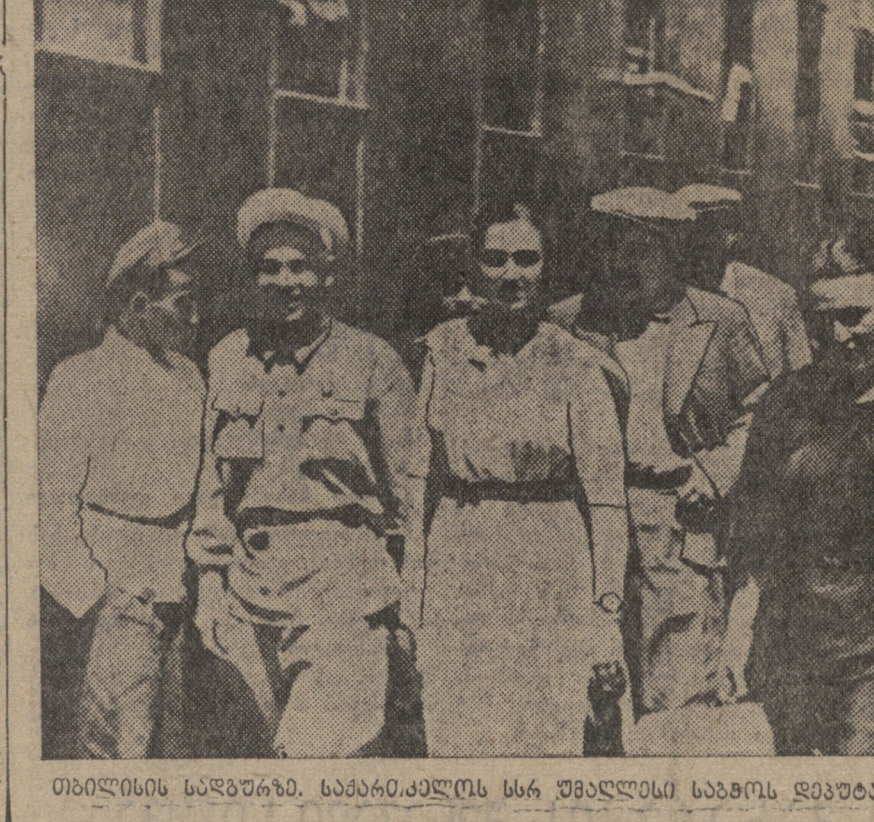
სიბღინის საბაჟურს, სამარიალს სსრ უმაღლესი საბჭოს დავალებით ახარდაც