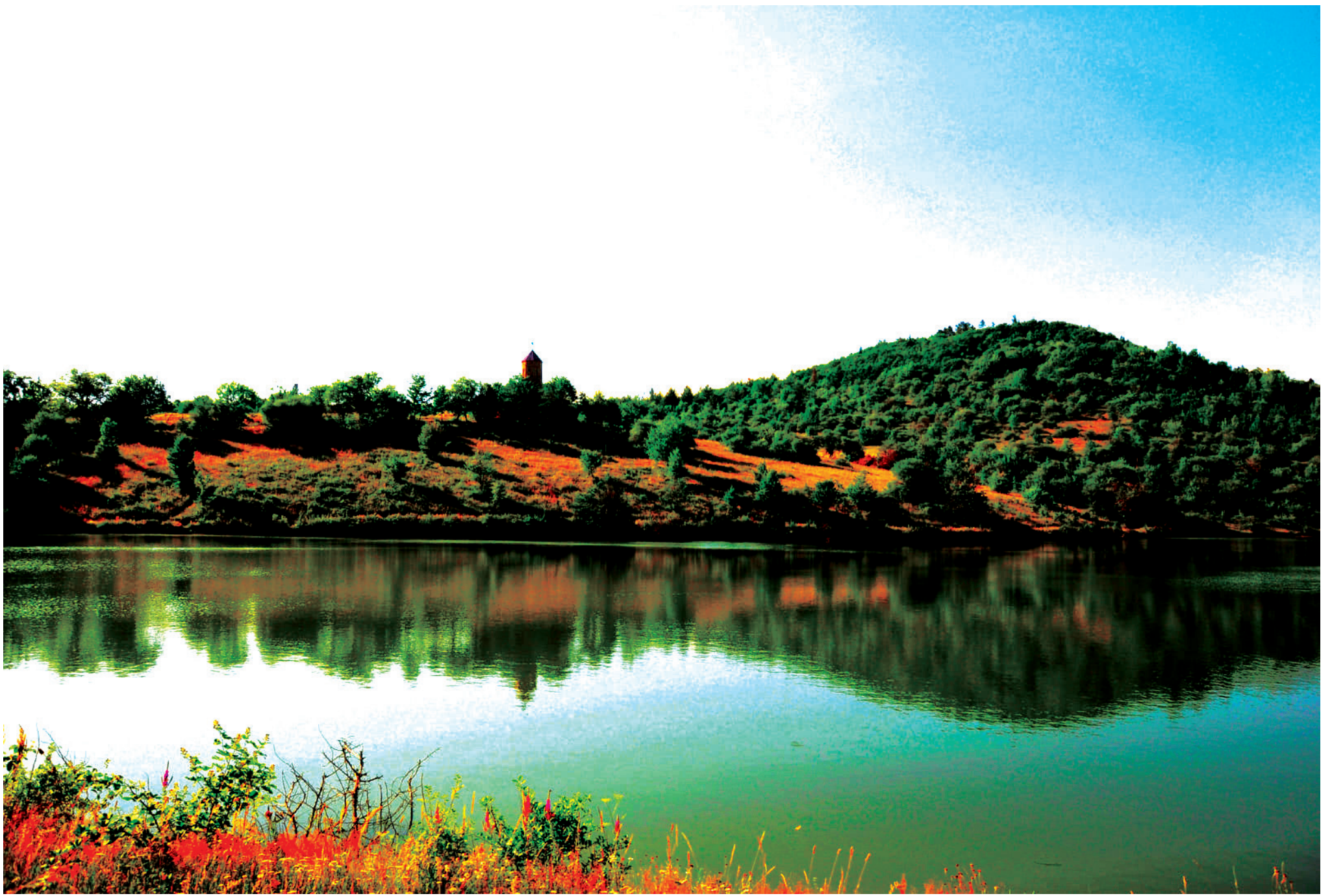
ხაშურის მუნიციპალიტეტის ტურისტული ობიექტები. კოლიწყაროს ტბა.