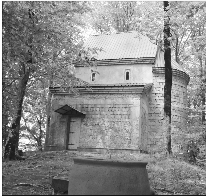
ქლარს შეადგენს. როგორც მუშაობს სამედიცინო ამბულატორია. მზევინარ ხომერკმა ჩვენთან საუბარში აღნიშნა, მერიას საკმაოდ დავტოვებდით ჩვენი მეგობრის, კარგი მკითხველი საზოგადოება ჰყავს, ბოლო დროს შეინიშნება ახალგაზრდების გააქ-

ასევე ადმინისტრაციის შენობაშია განთავსებული სოფლის ბიბლიოთეკა, რომლის წევრადი ფონდი 3600 ეკზემ-