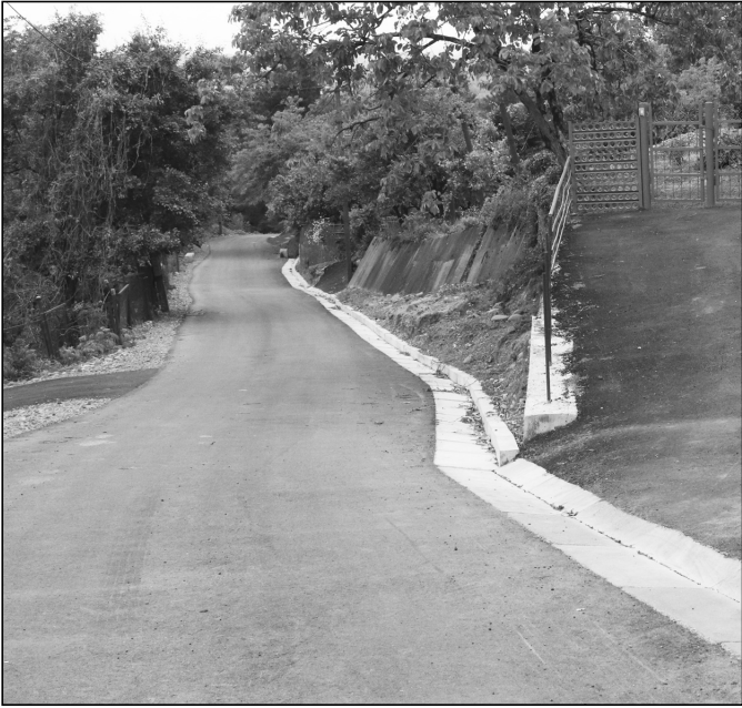
სახელად. მისგან ავითვისე ჩაის დამზადების ოჯახური ტექნოლოგია. ახლა რასაც გეტყვით, არც ზღაპარია და არც ჩემი ფანტაზიის ნაყოფი, სტალინს უგზავნიდნენ დელ-აქემის მიერ დამზადებულ შავი

ჰყავს. ეს არც პიარია და არც რეკლამა, ეს ახალგაზრდა, 35 წლის, უკვე ავტორიტეტული კაცი საოცრად უყვართ მშობლიური სოფლის ყველა კუთხე-კუთხულში. მერია ერთ-ერთი დიდი