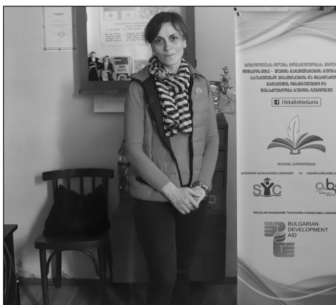
გაღვივდა ბულგარული საზო-

საფლავი რომ არ მოგვენახულებინა. მოკლედ, მერია დიდი პერსპექტივის სოფელია. შეიძლება ითქვას, რომ აქ გაღვივდა ბულგარული საზო-