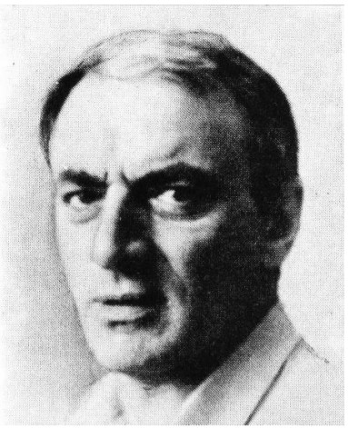
მურმან ჯგუბურია — 80

80 წლისა შესრულდა გამოჩენილი ქართველი მწერალი და საზოგადო მოღვაწე მურმან კონსტანტინეს ძე ჯგუბურია. ამის გამო საქართველოს მწერალთა კავშირმა იუბილარს მისალმება გაუგზავნა. მისალმებაში ნათქვამია: