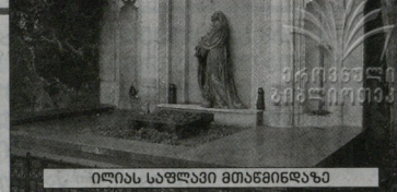
ილიას სასული მთაყინდავა

„პარალელა ილიასი, რომელიც მხოლოდ ერთის მხრიდან ბატონის, ნიანბნა იმისა, რომ ბარალმეკავით მის მეკლდელობაზე, ალბათ, ფსვი უფავეთ ამ ამიტომ ყოველდღისი-იმიანბნს, ათასგანდა საზოგადოებას სხარტონა, ილია დასანახავედ ბამიყვანონ, დასანახავედ, მოკლეს ღირსება, რათა თავი იმართლოს საზოგადოების წინაშე“.