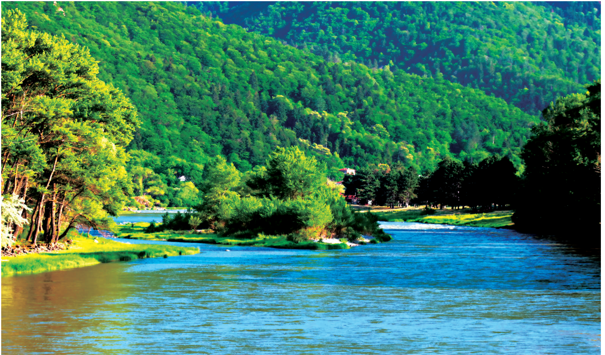
საქართველოს დელამინარე ტაშისკრისა და სათივის სანახებთან.