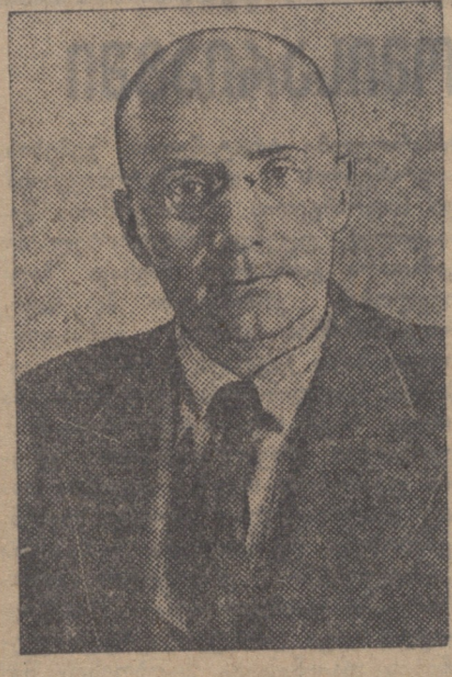
პროკურატორი აბ. ა. ი. სხვა