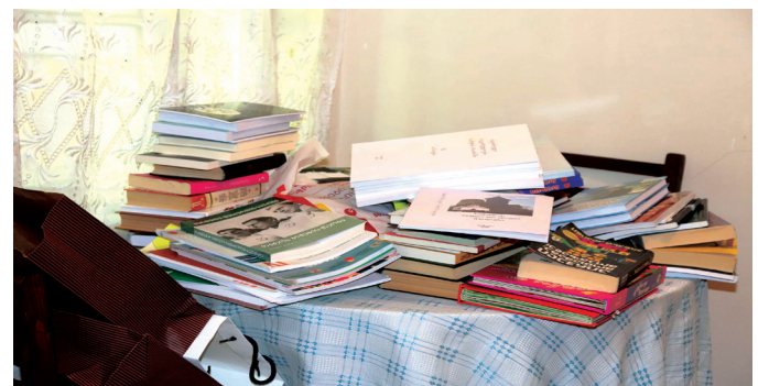
ახლად გახსნილმა სამკითხველომ, ადგილობრივებთან შეთანხმებით, სოფელ ჩორჩანის ერთ-ერთი მცხოვრების სახლში დაიდო ბინა.