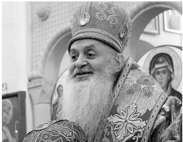
და სრულიად წყდებიან ეროვნულ ცნობიერებას და მენტალობას.

მაგრამ, რა ხდება, კონკრეტულად, ნინოშვილის პანსიონში?