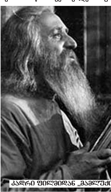
კადრი ფილმიდან „მამულში“

მეუფე: „მშობელს სტაცებთ შვილს? მშობელს უნდა, ბავშვი აქ იყოს. თქვენც გაიგონეთ... ამიტომ მე თქვენ გიცხადებთ, ეს არის ბავშვების დაყვანება, რომელიც თქვენმა უწყებამ გააკეთა რამდენიმეჯერ, ყველას გვასოსვს 7-შვილიანი და 9-შვილიანი ოჯახებს რომ წართვეს შვილები. ნუ