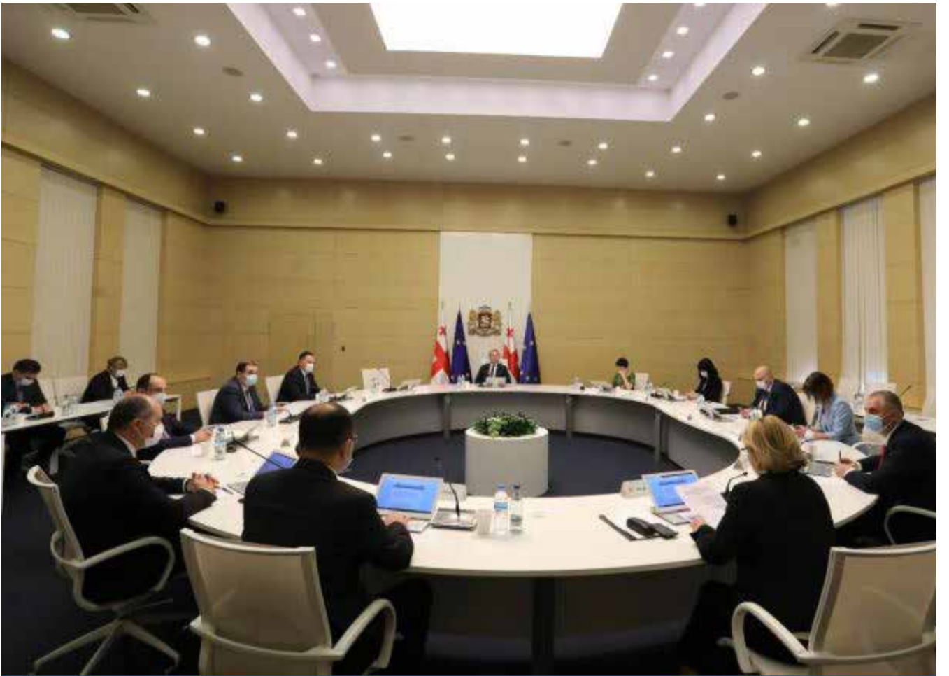
85 მილიონი ევრო მცირე და საშუალო საწარმოებისთვის – რა საგადასახადო შეღავათებით ისარგებლებენ გადასახადების გადამხდელები