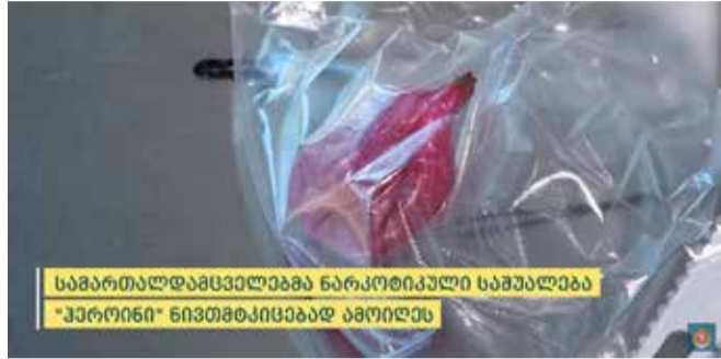
სამართალდამცველებმა ნარკოტიკული საშუალება „ჰეროინი“ ნივთმთქიცხადა ამოიღეს