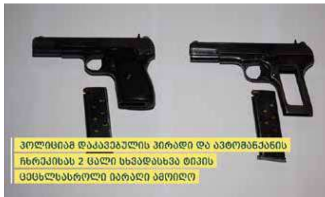
პოლიციამ დააკავეს პირადი და ავტომანქანის ჩხრეკისას 2 ცალი სხვადასხვა ტიპის ცეცხლსასროლი იარაღი ამოიღო

გამოძიება ცეცხლსასროლი იარაღის მართლსაწინააღმდეგო შექმნა-შენახვა ტარების ფაქტზე, საქართველოს სისხლის სამართლის კოდექსის 236-ე მუხლის მე-3 და მე-4 ნაწილებით მიმდინარეობს.