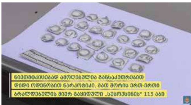
ნივთმტკიცებად ამოღებულია განსაკუთრებით დიდი ოდენობით ნარკოტიკი, მათ შორის ერთ-ერთი ბრალდებულის მიერ გაყიდული „სუბოქსინი“ 115 აბი

პოლიციამ თ.ქ. განსაკუთრებით დიდი ოდენობით ნარკოტიკული საშუალების უკანონო შექმნა-შენახვისა და გასაღების ბრალდებით დააკავა.