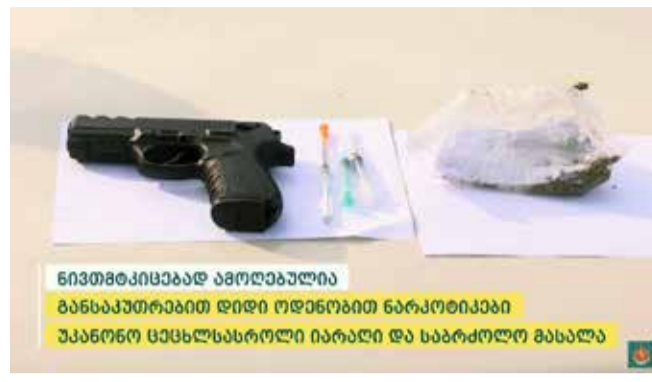
ნივთმტკიცებად ამოღებულია განსაკუთრებით დიდი ოდენობით ნარკოტიკები უკანონო ცეცხლსასროლი იარაღი და საბრძოლო მასალა

გამოძიება სისხლის სამართლის კოდექსის 260-ე მუხლის მე-6 ნაწილით, 236-ე მუხლის მე-3 და მე-4 ნაწილებით და 273-ე პრიმა მუხლით მიმდინარეობს.