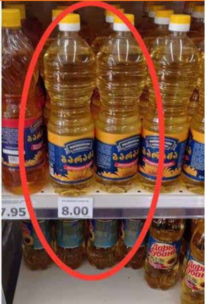
„ვერსიის“ ექსპერიმენტი – რა ღირს 1 ლიტრი ზეთი ევროპასა და აშშ-ში

1.653 დოლარია, რაც 2020 წლის სექტემბერში არსებულ ფასთან შედარებით, 465 დოლარით ანუ 39%-ით მეტია! FAO-ს ანგარიშის მიხედვით, ფასები სხვა მცენარეულ ზეთებზეც გაიზარდა. მაგალითად, 1 ტონა პალმის ზეთი 1.086 დოლარი ღირს, რაც წინა წელთან შედარებით, 46%-ით მეტია; 1 ტონა სიოს ზეთის ღირებულება – 1.136 დოლარია, რაც წინა წელთან შედარებით, 41%-ით მეტია.