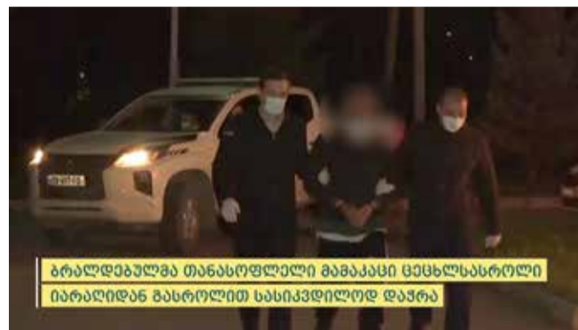
გარდაღებულია თანასოფელი მამაკაცი ცეცხლსასროლი იარაღიდან გასროლით სასიკვდილოდ დაჭრა

განზრახ მკვლელობის ფაქტზე გამოძიება საქართველოს სისხლის სამართლის კოდექსის 108-ე მუხლით მიმდინარეობს.