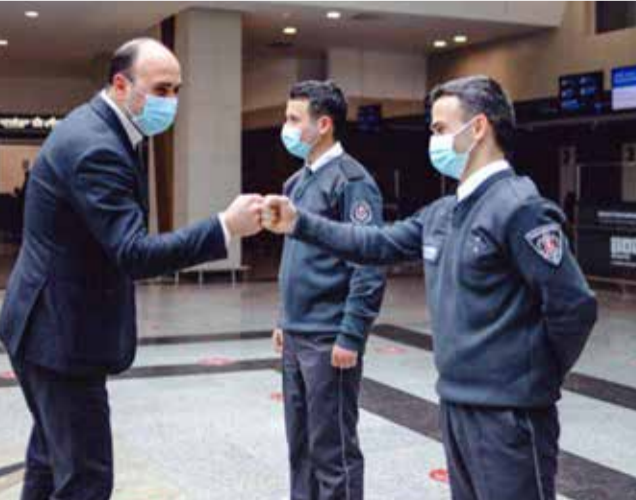
დაცვის პოლიციის მიერ დაცული სხვა სტრატეგიული ობიექტები მოინახულა.

შინაგან საქმეთა სამინისტროს სსიპ დაცვის პოლიციის დეპარტამენტის თავმჯდომარემ, გიორგი ბაგრატიონმა, იმერეთი-გურიის, სამეგრელო-ზემო სვანეთისა და აჭარის რეგიონალურ სამმართველოებში სამუშაო თათბირები გამართა.