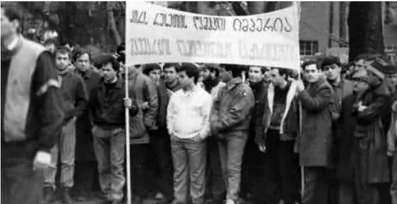
14 აპრილის 43-წლიანი ქრონიკა

მაშინ ორი წლის ვიყავი და, ცხადია, არაფერი მახსოვს, მაგრამ მერე, დრო რომ გავა, იმდროინდელი მოვლენების მონაწილეებს გავიცნობ და 1978 წლის 14 აპრილის „საიდუმლოსაც“ ამოვხსნი. ზოგადად, ეს „საიდუმლო“ დღეს უკვე ყველასთვის ნათელია – 43 წლის წინ, „დედა რუსეთი“ შეეცადა, მამულწარმეული ქართველებისთვის ენაც წაერთმია. კრემლში, ალბათ, არ ელოდნენ, რომ ღვთისმშობლის ნილხვედრი ქვეყნის შვილები საკუთარ ენას კბილებით დაიცავდნენ, მაგრამ როცა ქუჩაში უამრავი ადამიანი გამოვიდა, ბოლშევიკების ნათელი „ბუნაგი“ იძულებული გახდა, უკან დაეხია. ჰო, მაშინ ქართველებმა სასწაული ერთიანობა და ერთად დგომა აჩვენეს. დღეს?.. – ამაზე საუბარი შორს წაგვიყვანს და ამიტომ, მოდით, 43 წლის წინანდელი მოვლენები გავიხსენოთ.