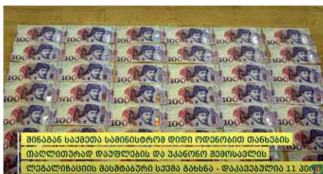
შინაგან საქმეთა სამინისტრომ დიდი ოდენობით თანხების თაღლითურად დაუფლებისა და უკანონო შემოსავლის ლეგალიზაციის მასშტაბური სქემა გახსნა - დაკავებულია 11 პირი

შინაგან საქმეთა სამინისტროს ცენტრალური კრიმინალური პოლიციის დეპარტამენტის ორგანიზებულ დანაშაულთან ბრძოლის მთავარი სამმართველოსა და გენერალური პროკურატურის თანამშრომლებმა, საერთაშორისო თანამშრომლობის ფარგლებში, ერთობლივად ჩატარებული ოპერატიული და საგამოძიებო ღონისძიებების შედეგად, 11 პირი დააკავეს და სისხლის სამართლის პასუხისგებაში მისცეს.