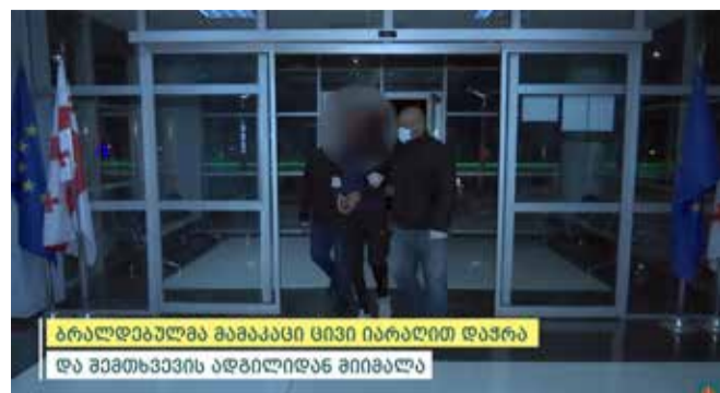
ბრალდებულმა მამაკაცი ცივი იარაღით დაჭრა და შემთხვევის ადგილიდან მიიშალა

ჯანმრთელობის განზრახ მძიმე დაზიანების ფაქტზე გამოძიება საქართველოს სისხლის სამართლის კოდექსის 117-ე მუხლის პირველი ნაწილით მიმდინარეობს.