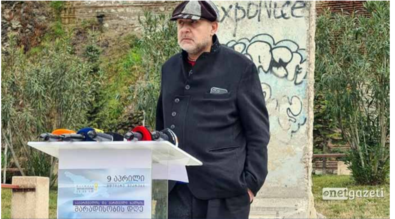
რას ნიშნავს „საქართველოსა და ქართველების მარადისობის დღე“ – რამდენიმე სურათი ძმები გაჩეჩილაძეების პოლიტიკური აწყობისა და წარსულიდან

ზოგადად, სანამ დაუპირისპირდებოდნენ და „ნაციონალების“ მმართველობას დაგობდნენ, ორივე ძმა, სააკაშვილის ლამის ძმადნაფიცი იყო. ყოველ შემთხვევაში, დღემდე არსებობს ფოტო თუ ვიდეოკადრი, როგორ ავიდა კონცერტის დროს მიშა სცენაზე და როგორი აღრთვანებული მისჩერებოდა „უცნობი“ „გიჟს“, თუმცა ამ აღტკინებამ მალე გაუარა და, ბოლოს, საქმე იქამდეც კი მივიდა, რომ წელანდელი თქმისა არ იყოს, ძმები გაჩეჩილაძეები, არა თუ ანტისააკაშვილისეუ-