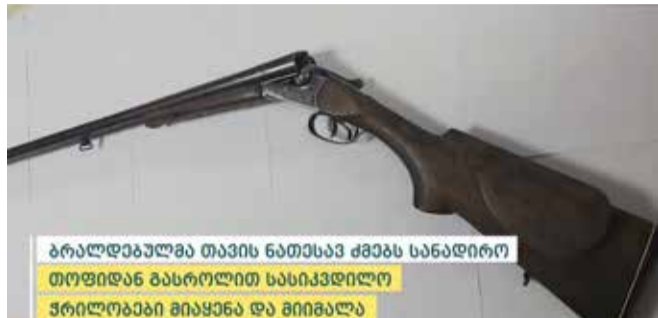
ბრალდებულმა თავის ნათესავ ძმებს სანადირო თოფიდან გასროლით სასიკვდილო ზრილობები მიყენა და მიიშალა

შინაგან საქმეთა სამინისტროს იმერეთის, რაჭა-ლეჩხუმისა და ქვემო სვანეთის პოლიციის დეპარტამენტის დეტექტივების სამმართველოს თანამშრომლებმა, ჩატარებული ოპერატიულ-სამძებრო და საგამოძიებო მოქმედებების შედეგად, 1992 წელს დაბადებული ღ.მ. ცხელ კვალზე დააკავეს. მას ბრალად, დამამძიმებელ გარემოებაში ჩადენილი ორი პირის განზრახ მკვლელობა ედება.