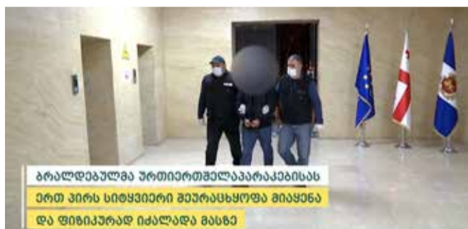
ბრალდებულმა პრტიპრტიმალაპარაკებისას ერთ პირს სიძვირიერ შეურაცხყოფა მიყენა და ფიზიკურად იძალადა მასზე

შინაგან საქმეთა სამინისტროს თბილისის პოლიციის დეპარტამენტის ძველი თბილისის მთავარი სამმართველოს თანამშრომლებმა, ჩატარებული ოპერატიულ-სამძებრო და საგამოძიებო მოქმედებების შედეგად, 1997 წელს დაბადებული ნ.დ., ძალადობის ბრალდებით, თბილისში დააკავეს. დანაშაული 1 წლამდე ვადით თავისუფლების აღკვეთას ითვალისწინებს.