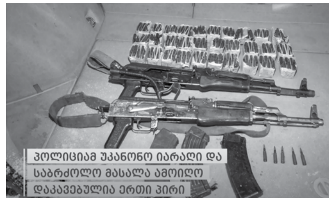
პოლიციამ უკანონო იარაღი და საბრძოლო მასალა ამოიღო დააკავებულება ერთი პირი

ცეცხლსასროლი იარაღისა და საბრძოლო მასალის მართლსაწინააღმდეგო შექმნა-შენახვისა და გადაზიდვის ფაქტზე, გამოძიება საქართველოს სსსხლის სამართლის კოდექსის 236-ე მუხლის მე-3 და მე-5 ნაწილებით მიმდინარეობს.