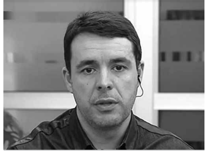
ოპოზიცია საგანგებო რეჟიმის ექსკლუზიური დეტალებით