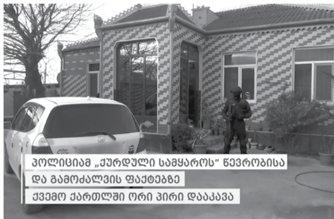
პოლიციამ „ქურდული სამყაროს“ წევრობისა და გამოძალვის ფაქტებზე ქვემო ქართლში ორი პირი დააკავა

შინაგან საქმეთა სამინისტროს ქვემო ქართლის პოლიციის დეპარტამენტის გარდაბნის რაიონული სამმართველოსა და რუსთავის რაიონული პროკურატურის თანამშრომლებმა, ერთობლივად ჩატარებული ოპერატიულ-სამძებრო და საგამოძიებო ღონისძიებების შედეგად, სასამართლოს განჩინების საფუძველზე, ორი პირი დააკავეს.