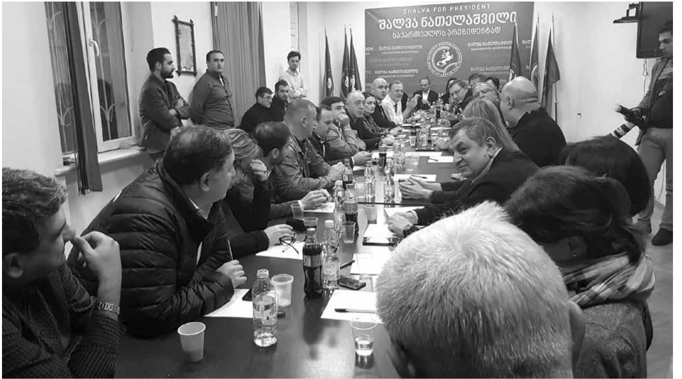
ვინ აპირებს პარლამენტში შესვლას და ვინ არა – ლიდერების პასუხი ყველაზე აქტუალურ კითხვაზე

„პარტიები ვთანხმდებით, რომ მოლაპარაკების გზით უნდა გადაწყდეს ის მთავარი საკითხები, როგორებიცაა პოლიტიკატიმრების გათავისუფლება, ხელახალი არჩევნები და ის წესებიც უნდა განისაზღვროს, რომელიც განაპირობებს სამართლიან არჩევნებს.“