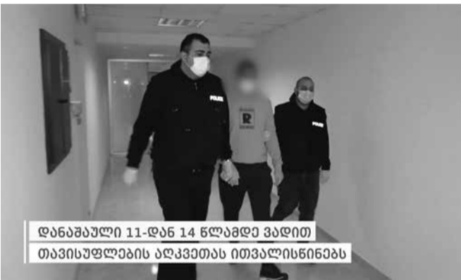
დანაშაული 11-დან 14 წლამდე ვადით თავისუფლების აღკვეთას ითვალისწინებს