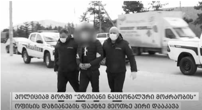
პოლიციამ გორში "ერთიანი ნაციონალური მოძრაობის" ოფისის დაზიანების ფაქტზე ოთხი პირი დააკავა

შინაგან საქმეთა სამინისტროს შიდა ქართლის პოლიციის დეპარტამენტის გორის რაიონული სამმართველოს თანამშრომლებმა, ჩატარებული ოპერატიულ-სამძებრო და საგამოძიებო მოქმედებების ფარგლებში, გორში, ერთიანი ნაციონალური მოძრაობის ოფისის დაზიანების ფაქტზე, კიდევ ერთი პირი – 1994 წელს დაბადებული თ.მ. დააკავეს. მას ბრალი სხვისი ნივთის დაზიანებაში ედება.