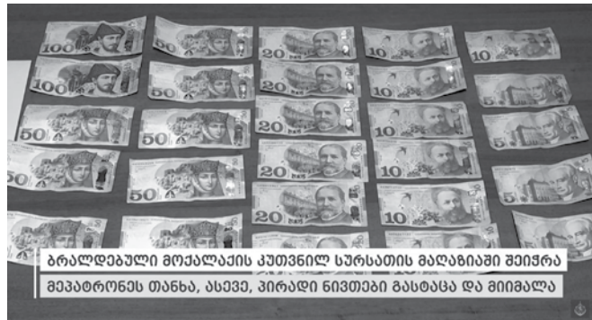
ბრალდებული მოქალაქის კუთვნილ სურსათის მაღაზიაში შეიჭრა, მეპატრონეს თანხა, ასევე, პირადი ნივთები გასტაცა და მიიმალა

დაკავებული ჩადენილ დანაშაულს აღიარებს. გამოძიება საქართველოს სისხლის სამართლის კოდექსის 179-ე მუხლით მიმდინარეობს, რაც ყაჩაღობას გულისხმობს.