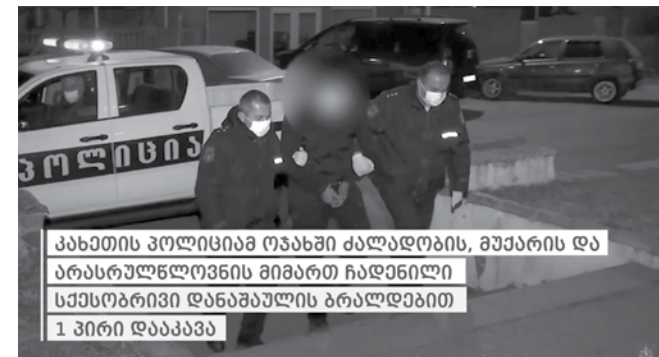
კახეთის პოლიციამ ოჯახში ძალადობის, მუქარისა და არასრულწლოვნის მიმართ ჩადენილი სქესობრივი დანაშაულის ბრალდებით 1 პირი დააკავა

გამოძიება საქართველოს სისხლის სამართლის კოდექსის 11 პრიმა 151-ე მუხლის მე-2 ნაწილის „დ“ ქვეპუნქტით, 126-ე პრიმა მუხლის მე-2 ნაწილის „ა“, „ბ“ და „გ“ ქვეპუნქტებით და 137-ე მუხლის მე-4 ნაწილის „დ“ ქვეპუნქტით მიმდინარეობს.