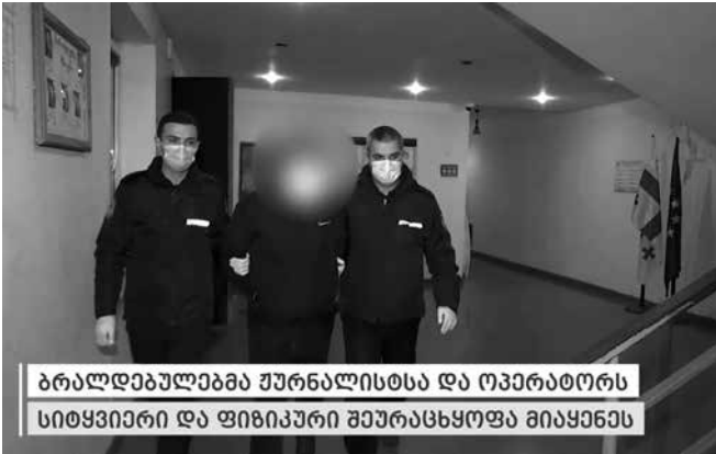
ბრალდებულთა შერჩევისას და ოპერატიული სიტყვიერი და ფიზიკური შეურაცხყოფა მიყენეს