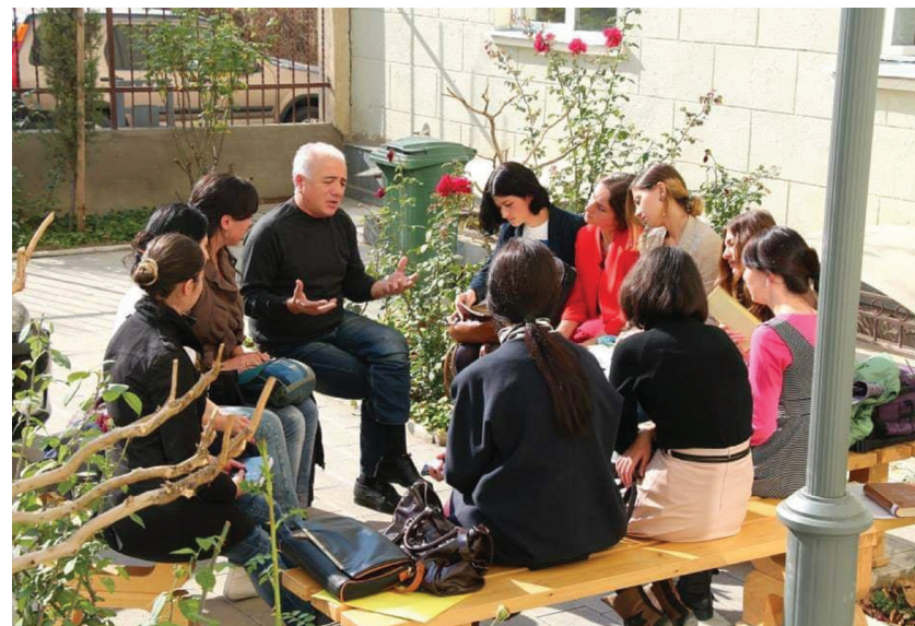
ლევცია მზის გულზე