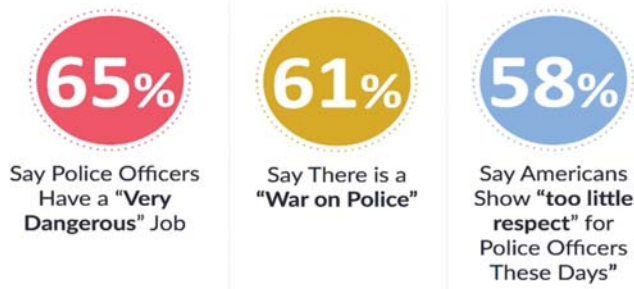
Fig. 1. The relationship of youth with the police

The data presented in the figure show that two-thirds (65%) of young respondents say that police officer has „very dangerous” work, 30% believe that working in the police is „somewhat dangerous”, and only 5% believe that their work is not very dangerous.