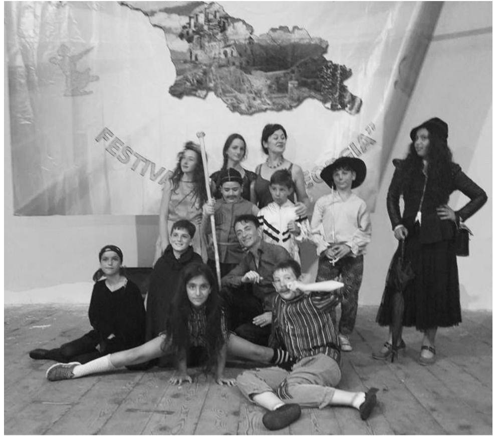
საბაგში თეატრალური ნრე „აკარიუმი“

ვულორავთ წარმატებას ყველა შემოქმედებით კოლექტივს. მათი წარმატება ხაშურის წარმატებაა.