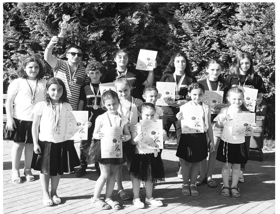
ბაგშია ხეცხრალი ანსამბლი „აკარიუმი“