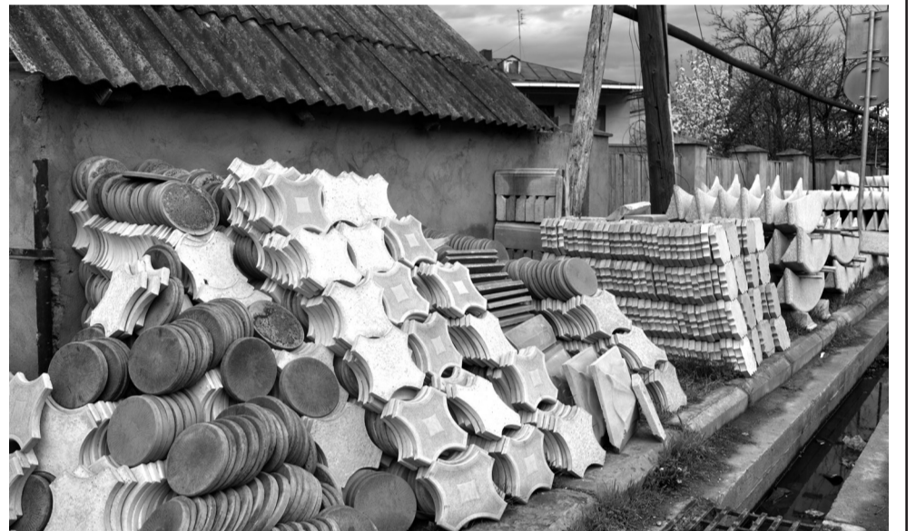
უარი და არც ჩვენებურ მასპინძლობაზე. ამ უბნის “ინდუსტრიული” ისტორია კი ასე იწყება:

ყველა ქალაქს თავისი ამბავი აქვს, ისტორია, რომელიც ქმნის, ავითარებს და სახელს აძლევს-ეს გამოარჩევს, ეს აძლევს მრავალფეროვნებას. ჰამაკი და ნაზუქი, ხაშურის „ცოცხალი“, ისეთი ნიშაა, რომელსაც ასოციაციურად უკვე მოეყვართ ჩვენ ქალაქამდე, თუმცა, მხოლოდ