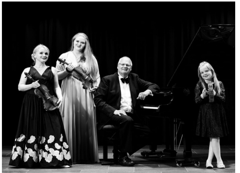
ბერკემერების მუსიკალური ოჯახი

უვე უნიკალური ნიჭის ადამიანია, რამდენიმე პროფესიას ფლობს. იდეალური მეუღლეა, მაფასებს და მანებივრებს. კარგი მზარეულიც არის. საქმლის მომზადება ჩვენ ოჯახში მე არ მეხება. ქართული სამზარეულო თვითონაც მოსწონს და გურმანიც გახლავთ. 2005 წელს, უვემ საქართველოში რჩეული კავკასიელი მუსიკოსების კამერული ორკესტრი შექმნა, რომელიც 2008 წელს აგვისტოს ომის დროს დაიშალა. თუმცა, ამ პროექტის ფარგლებში, კვლავ ჩამოგვყავს გერმანიაში ორკესტრი და ისევ ვმართავთ კონცერტებს ევროპის ქალაქებში. 2017 წელს, საქართველოში კამერული მუსიკის ფესტივალი ჩავატარეთ.