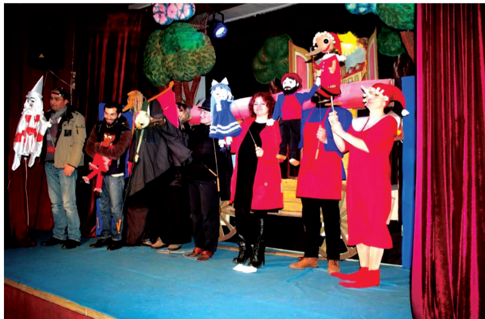
ამ საოცარმა დასმა ჯერ ხომ ჩვენი მუნიციპალიტეტის პატარების

„მივედი, ვნახე, გავიმარჯვე“- ეს ცნობილი სენტენცია, გადამეტების გარეშე, აბსოლუტურად მიესადაგება ხაშურის თოჯინების თეატრს.