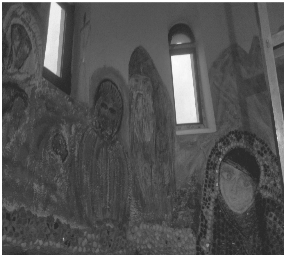
„ჩვენ კი არა, უფალმა შეგიშვა თავის სახლში...“