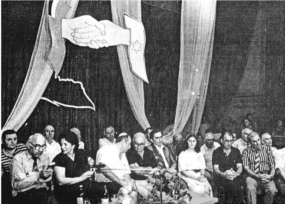
შეხვედრა სურამის ყულუცურის სახლში. 1989 წელი.

ახალგაზრდა თაობის კეთილგანწყობის მოსაპოვებლად სკოლის დირექტორი უნდა იყოს ლიდერი და არა, უბრალოდ, მენეჯერი, შემოქმედი და არა, უბრალოდ, „შემსრულებელი“, მოტივირებული და არა ნიჰილისტი, ინოვაციური და არა მხოლოდ ტრადიციული, ღია და არა ჩაკეტილი, უნდა იყო საგანმანათლებლო ლიდერი და არა, მხოლოდ „იმუშაო სკოლის დირექტორად“.