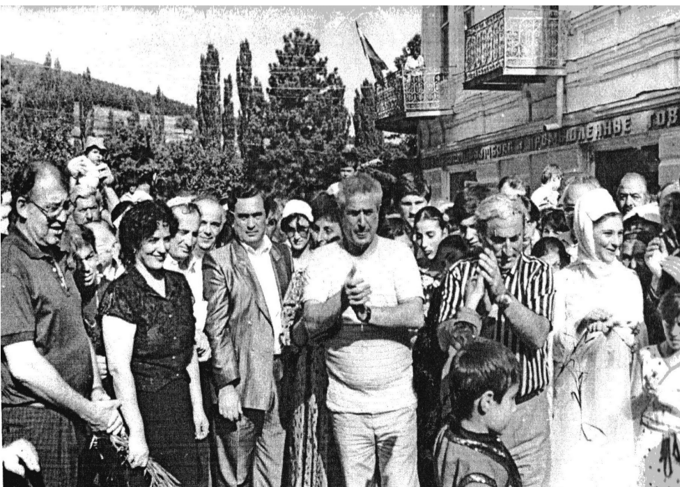
ქობულეთის ღელეფიცია სურამში. 1989 წელი.

– რაში მდგომარეობს დღევანდელი თაობის „სიტყვის თავისუფლებისა“ და ჩვენი თაობის „აკრძალვების“ დადებითი და უარყოფითი მხარე?