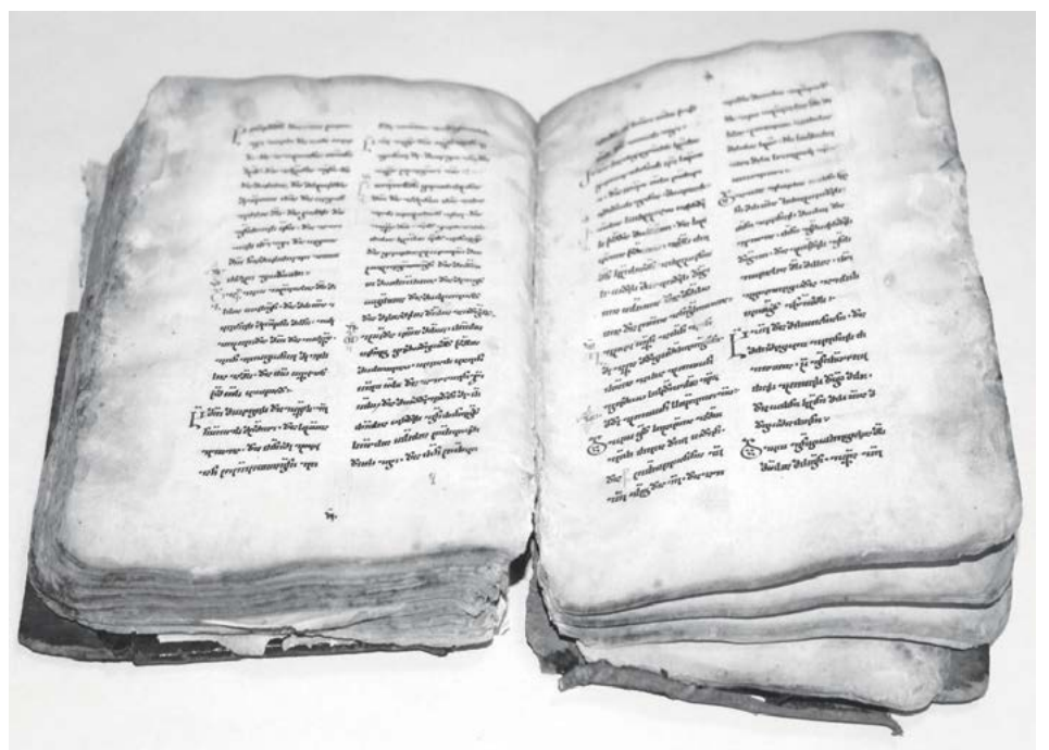
ოსიურის წმინდა გიორგის სახელობის ეკლესიაში აღმოჩენილი მე-16 საუკუნის „სახარება“