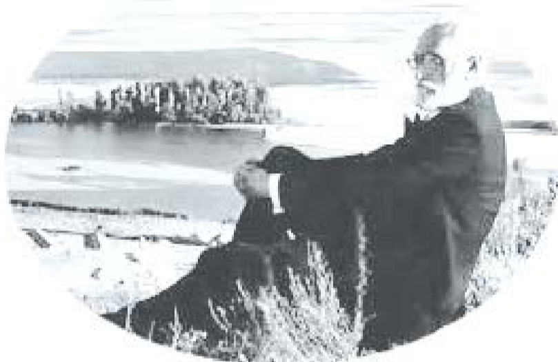
მიგელ დე უნამუნო

ამისთვის კი, უნდა შექმნა სამყარო, ეძიო იგი შენშივე „სულის სიღრმეში!“.