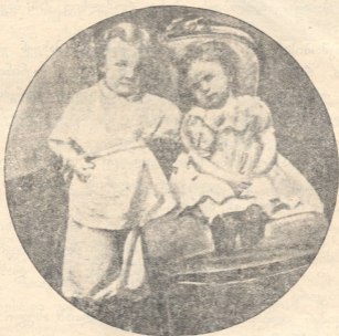
ვ. ლენინი პატარაობისას თავის დასთან ერთად.

— რას აზობ! ის ყოველთვის სწავლობდა. ასი ათასი წიგნი წაიკითხა.