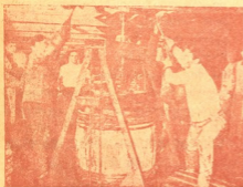
დაჭრილ თევზს კასრებში აწყობენ.

ამოიყვანეს დაქერილი თევზები, გამოშვიგნეს, ღვიძლისაგან თევზის ქონი გამოწურეს, თევზი დაამარილეს, ჩააწყეს კასრებში და რკინის გზით ჩვენსკენ გამოგზავნეს.