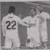
„ლივერპულთან“ ორნაუნდში ან დაპირისპირებაში გამარჯვებული რეალმა

ბის შედეგად (3:0, 0:0), „რეალმა“ წმინდა ლიგაში საკუთარი რეკორდი გააუმჯობესა და ისტორიულ პირველი კლუბი გახდა, რომელიც 1/2 ფინალში მე-14-ედ ითამაშებს. მადრიდელთა უახლესი მწვერბლი - „პარსელინა“-ს „პაიერი“ მთავარი ვეროლტურნისი 1/2 ფინალში 12-12 უკერ გასულა.