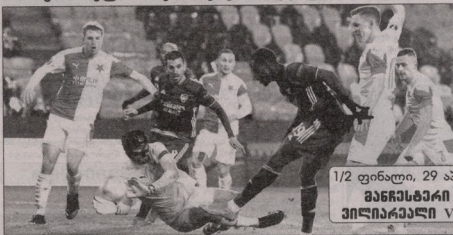
1/2 ფინალი, 29 აპრილი-6 მაისი მანჩესტერი VS რომა ვილიარეალი VS არსენალი

არსენალმა ლონდონური ყაიფის შედეგად პრადეში გამანადგურებელი ანგარიშით იმარჯვა „მეთოფეები“ ევროპალიგის 1/2 ფინალში ყოფილი მწვრთნელის - უნაი ემერის გუნდს შეხვდებიან