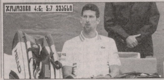
ჯოკოვიჩი 4:6; 5:7 უანსი

ჯოკოვიჩი რეიტინგის 33-ე ნომერი ევანსთან დამარცხდა და მოგზავნა კარლოს დაეგვილოვა